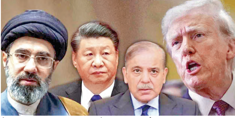
ప్రారంభమైనప్పటి నుండి, చైనా శాంతిని ప్రోత్సహించడానికి, శత్రుత్వాలను నివారించడానికి చురుకుగా కృషి చేస్తోంది అన్నారు. కాబుల విరమణకు అంగీకరించడానికి ఇరాన్ కు చైనా సహాయం చేసినందుకు తాను సముఖతున్నట్లు అమెరికా అధ్యక్షుడు డొనాల్డ్ ట్రంప్ చేసిన ప్రకటనను ఉద్దేశించి ఆయన ఈ విధంగా స్పందించారు. కాబుల విరమణ ఒప్పందానికి అంగీకరించి,

చెంబో, ఏప్రిల్ 8: అమెరికా, ఇరాన్ ల మధ్య 40వ రోజుకు చేరిన యుద్ధ కాల్పుల ఎట్టకేలకు చల్లాయి. ఇరాన్ పై జరిపే భారీ సైనిక దాడుల నుంచి ట్రంప్ వెనక్కి తగ్గి, రెండు వారాల పరతులతో కూడిన కాబుల విరమణను ప్రకటించారు. ఈ నిర్ణయానికి, హార్డుకోర్ జలసంధిని తిరిగి తెరవడానికి మార్గం సుగమం అయ్యింది. ఈ ప్రకటన ప్రపంచవ్యాప్తంగా ఉత్సాహాన్ని కలిగించింది. ఈ కాబుల విరమణకు పాకిస్తాన్ ప్రధాని షాబాజ్ షరీఫ్, ఫిట్ మార్కెట్ అసెమ్ మునీర్ క్రెడిట్ తీసుకుంటున్నారు. కాబుల విరమణకు అంగీకరించే ఇరాన్ ను ఓర్వించడంలో చైనా కీలక పాత్ర పోషించింది. అమెరికా అధ్యక్షుడు డొనాల్డ్ ట్రంప్ విదేశీ స్వయంగా దీనిని ప్రకటించారు. చైనా విదేశాంగ మంత్రిత్వ శాఖ ప్రతినిధి మాజీ సీనియర్ బుధ్ధవారం మీడియా సమావేశంలో మాట్లాడుతూ, ఇరాన్ వివాదం