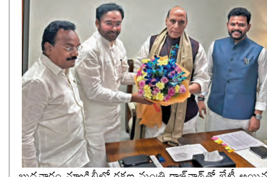
బుధవారం న్యూఢిల్లీలో రక్షణ మంత్రి రాజ్ నాథ్ తో భేటీ అయిన కేంద్రమంత్రులు కిషన్ రెడ్డి, రామ్మోహన్ నాయుడు

తెలిపారు. రాష్ట్రంలోని విద్యార్థుల సంఖ్యలో హైదరాబాద్ నగరంలోనే 44 శాతం ఉన్నారు, వారికి నాణ్యమైన విద్య అందించాలని భావించిన మన అందరినీ ఉండవలసిందిగా కోరారు. కంపెనీలు స్థానికంగా ఉన్న అన్ని మౌలిక వసతులను వినియోగించుకోవాలని కోరారు. తమ సీఎన్ఆర్ నిధుల్లో ఎక్కువ మొత్తాన్ని అదే ప్రాంత అభివృద్ధికి కేటాయించాలన్నారు. సీఎన్ఆర్ నిధుల వినియోగంలో ఇప్పటి వరకు సరైన విధానం లేనందున తాము ఒక ప్రత్యేక ప్రధాన కార్యదర్శిని ఇందుకు నియమించామని సీఎం తెలిపారు. కంపెనీల ప్రతినిధుల ఆయనతో సమన్వయం చేసుకొని తమకు ఆసక్తి ఉన్న విద్యా, వైద్యం, జల వనరులు, వైపుణ్య శిక్షణ, వాహనత్య కట్టడాల వసతులను అందజేయాలని కోరారు. కంపెనీల ప్రతినిధులను అభివృద్ధికి కేటాయించేందుకు ముందుకు వచ్చాలని వారికి సీఎం ఆహ్వానించారు. కంపెనీల ప్రతినిధులు స్పందిస్తూ