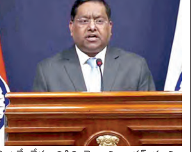
వెంటనే దేశ విడివిడి వెళ్లాలని భారత్ సూచించింది. ఇరాన్ లోని తమ రాయబార కార్యాలయం అందించిన మార్గాలను ఉపయోగించి మహానగరాల భారత్ తన పౌరులకు సలహా ఇచ్చింది. టెక్నోలోని భారత్ రాయబార కార్యాలయం బుధ్ధవారం ఒక సలహాలో పేర్కొంది, ఏప్రిల్ 7నాటి సలహాను కొనసాగించగా ఇటీవలి పరిణామాలు దృష్ట్యా, ఇరాన్ లో ఉన్న భారత్ పౌరులను రాయబార కార్యాలయంలో సమన్వయం చేసుకుని, అది సూచించిన మార్గాలను ఉపయోగించి వీలైనంత త్వరగా ఇరాన్ ను విడివిడి వెళ్లాలని సూచించింది. రాయబార కార్యాలయంలో ముందస్తు సంప్రదింపులు, సమన్వయం లేకుండా ఏ అంతర్జాతీయ భూ సరిహద్దును సమీపించడానికి ప్రయత్నించవద్దని పునరుద్ధరించిన భారత్ రాయబార కార్యాలయం పేర్కొంది. ఈ సలహాలో, రాయబార కార్యాలయం తన పౌరుల కోసం అత్యవసర సంబంధన అందుబాటులో ఉంచింది.

న్యూఢిల్లీ, ఏప్రిల్ 8: అమెరికా-ఇరాన్ సంఘర్షణలో కాబుల విరమణ ప్రకటనపై భారత్ ప్రభుత్వం తోలిసారే స్పందించింది. బుధ్ధవారం విదేశాంగ మంత్రిత్వ శాఖ కాబుల విరమణను స్వాగతించి ఒక ప్రకటనను జారీ చేసింది. ఈ కాబుల విరమణ పశ్చిమ ఆసియాలో శాశ్వత శాంతిని నెలకొల్పటానికి ఆశీర్వాదాలు మంత్రిత్వ శాఖ పేర్కొంది. ఉద్రిక్తతలకు చర్చల ద్వారా పరిష్కారం లభించాలని భారత్ తరఫున మొదటి నుంచి వాదిస్తోంది. విదేశాంగ ప్రతినిధి రణజిత్ జైన్ ప్రకటించారు. ప్రస్తుత సంఘర్షణకు త్వరితగతిన ముగింపు పలకడానికి ఉద్రిక్తతలను తగ్గించడం అత్యవసరమని, శాంతిని నెలకొల్పడానికి చర్చలు, దౌత్యం కీలకమని మేము నిరంతరం చెబుతూనే ఉన్నామని ఆ ఆయన అన్నారు. నెల రోజులకు పైగా కొనసాగుతున్న అమెరికా-ఇరాన్ సంఘర్షణ పురుషణ పల్ల జరిగిన నష్టంపై విదేశాంగ మంత్రిత్వ శాఖ తన ప్రకటనలో ఆందోళన వ్యక్తం చేసింది. ఈ పురుషణ ప్రపంచవ్యాప్తంగా అధిక సంఖ్యలకు, వాణిజ్య నష్టాలకు దారితీసింది. ఈ పురుషణ ప్రపంచవ్యాప్తంగా అలభ్యతలను కలిగించింది. పౌరులకు తీవ్ర ఇబ్బందులు కలిగించింది మంత్రిత్వ శాఖ పేర్కొంది. హార్డుకోర్ జలసంధి ద్వారా ఇంధన సరఫరాలు, ప్రపంచ వాణిజ్యం ఇకపై కొనసాగుతాయని ఆశీర్వాదాలు పేర్కొంది.