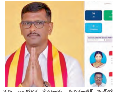
పట్టి ఆందోళన చేపట్టారు. సినిమాటిక్ స్టైల్ లో జరిగిన ఈ అభ్యుదయ వెనుక రాజకీయ కుట్ర ఉందా లేక నామినేషన్ రిజెక్ట్ అవుతుందని తెలిసి అభ్యుదయ తప్పుకున్నారా అన్నది ఇప్పుడు

నియమాన్ని పాటించకపోవడంలో ఎడప్పాడి టీవీకె అభ్యుదయ కమిటీ కుమార్ నామినేషన్ వీగిపోయింది. ఎన్నికల యుద్ధ భూమిలోకి కత్తి పట్టుకుందానే విజయ స్వయం ఓటుమిని అంగీకరించిన విజయం. ప్రత్యక్షమైన అభ్యుదయ నిత్యా నామినేషన్ కూడా ఇది కారణం. రిజెక్ట్ అప్పడం ప్రార్థిని అజ్ఞానం వల్లీ చూపుతోంది. హేమహేమీలు పోటీ పడే వోల ఇంతటి చిన్న తప్పులు చేయడం విజయ రాజకీయ భవిష్యత్తుపై విమర్శలకు తావిస్తోంది. అభ్యుదయ కమిటీ మాయం కావడం ఈ కథలో అసలైన ట్విస్ట్. నామినేషన్ పరిశీలన సమయంలో ఆయన కనిపించకపోవడంలో ప్రత్యర్థి ప్రార్థిని వారు కిద్దామీ చేశారంటూ టీవీకె కార్యకర్తలు రోషానికి