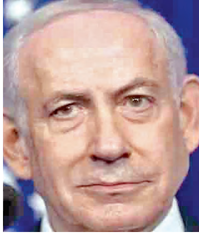
అక్కడి ప్రజలందరూ నగరం నుంచి తరలి వెళ్లాలని సూచించింది. ఇప్పటిదాకా అటు ఇరాన్ పై విరుచుకుపడుతూనే, ఇటు లెబనాన్ పై కూడా ఇజ్రాయెల్ దాడి చేసింది. ఈ దాడులకు బదులుగా ఇరాన్ కూడా ఎదురు దాడికి దిగింది. కానీ, అమెరికాతో ఇప్పుడు కుదిరిన కాబుల ఒప్పందం ప్రకారం హెజ్బల్లా కూడా కాబుల విరమణ పాటిస్తున్నట్లు తెలుస్తోంది. మరోవైపు ఇరాన్ కూడా బుధ్ధవారం ఉదయం దుబాయ్, సౌదీ, కువైట్ వంటి గల్ఫ్ దేశాలపై కొన్ని క్షిపణుల్ని ప్రయోగించినట్లు సమాచారం అయితే, వాటిని రక్షణ వ్యవస్థలు అడ్డుకున్నట్లు ఆ దేశాలు ప్రకటించాయి.

టెర్రెస్ట్, ఏప్రిల్ 8: ఇరాన్ అమెరికా మధ్య కాబుల విరమణ ఒప్పందం కుదిరినప్పటికీ ఇజ్రాయెల్ -ఇరాన్ మధ్య ఉద్రిక్తతలు ఇంకా తగ్గినట్లు కనిపించడం లేదు. ఈ ఒప్పందాన్ని స్వాగతించిన ఇజ్రాయెల్ ఇది లెబనాన్ కు మాత్రం వర్తించదని బోధించి చెప్పింది. దక్షిణ లెబనాన్ పై ఇజ్రాయెల్ దాడులు చేస్తూనే ఉంది. దీనిపై ఇరాన్ స్పందించింది. లెబనాన్ పై దాడులు ఆపకుంటే ఇజ్రాయెల్ పై తాము కూడా దాడులు చేస్తామని ఇరాన్ హెచ్చరించింది. ఈ మేరకు ఇరాన్ యన్ సేషన్ ల సభ్యులతో కౌన్సిల్ బుధ్ధవారం ఒక ప్రకటన విడుదల చేసింది. ముఖ్యంగా గల్ఫ్ లోని దక్షిణ లెబనాన్ పై దాడులు ఆపకపోతే మేం ఇజ్రాయెల్ పై వైమానిక, క్షిపణి దాడులు చేస్తామని హెచ్చరించింది. అమెరికాలో కుదిరిన కాబుల విరమణ ఒప్పందంలో ఇరాన్ తమతోపాటు లెబనాన్ వంటి తమ మిత్ర దేశాలపై కూడా పౌరులను రాయబార కార్యాలయంలో సమన్వయం చేసుకుని, అది సూచించిన మార్గాలను ఉపయోగించి వీలైనంత త్వరగా ఇరాన్ ను విడివిడి వెళ్లాలని సూచించింది. రాయబార కార్యాలయంలో ముందస్తు సంప్రదింపులు, సమన్వయం లేకుండా ఏ అంతర్జాతీయ భూ సరిహద్దును సమీపించడానికి ప్రయత్నించవద్దని పునరుద్ధరించిన భారత్ రాయబార కార్యాలయం పేర్కొంది. ఈ సలహాలో, రాయబార కార్యాలయం తన పౌరుల కోసం అత్యవసర సంబంధన అందుబాటులో ఉంచింది.